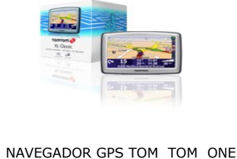
NAVEGADOR GPS TOM TOM ONE

Gestionamos en nuestros centros los Certificados de Profesionalidad de los trabajadores.