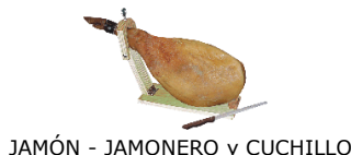
JAMÓN - JAMONERO y CUCHILLO

Forma T Campus Virtual http://campus.forma-t.es