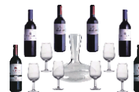
DECANTADOR Y VINOS